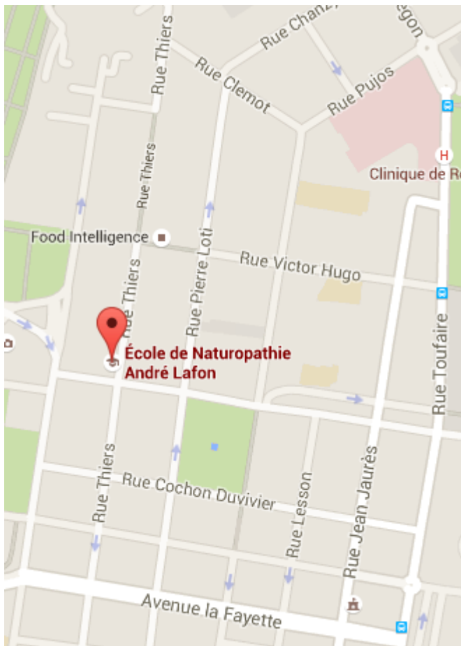
CNR « Ville » 97 rue Thiers 17300 Rochefort

Le CNR « Campagne » de St-Agnant : St Martin 17620 St-Agnant Salle de formation