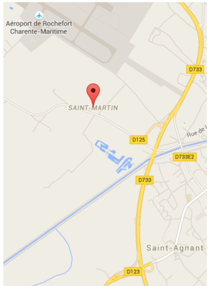
CNR « Campagne » Saint-Martin 17620 Saint-Agnant